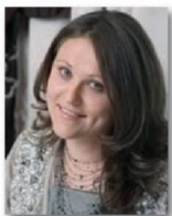
Автор проекта: архитектор Елена Булагина Архитектурное бюро «Капиталь»

Дизайн просторной квартиры в историческом центре Москвы выдержан в стиле ар деко и отличается роскошью отделки. Для интерьера характерны смелые и контрастные цветовые решения. Вместе с тем не упущены и продуманы вопросы практичности каждого помещения.