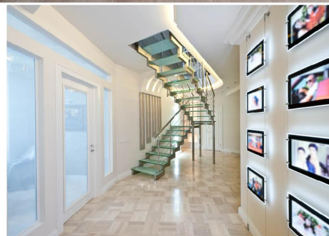
Лестница холла, ведущая на второй уровень квартиры, выполнена в стиле хай-тек с сочетанием соответствующих материалов — стекла и нержавеющей стали. Конфигурация динамичной формы и технологичность решений гармонично уживаются с эстетикой визуального восприятия