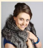
Автор проекта: архитектор Елена Булагина (архитектурное бюро «Капитель») (г. Москва)

«Пентхаус — пространство, открывающее новые горизонты как для проектирования, так и для проживания, расширяя привычные границы и увлекая в гармонию бесконечности»