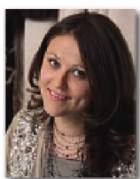
Автор проекта: архитектор Елена Булагина (архитектурное бюро «Капитель»)